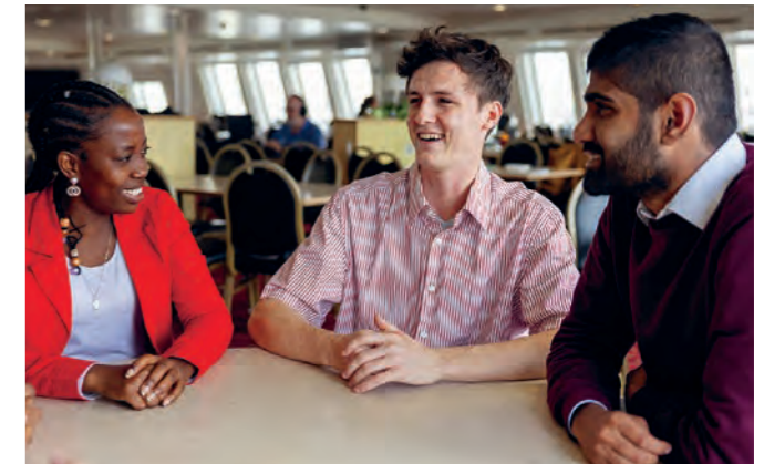
Gemeinsames Leben mit unterschiedlichen Kulturen ist manchmal herausfordernd aber auch bereichernd

Hier lebt man auf engstem Raum mit über 300 Menschen aus unterschiedlichen Regionen der Erde zusammen, aber wir alle glauben an Gott und haben das gleiche Ziel: Ihm