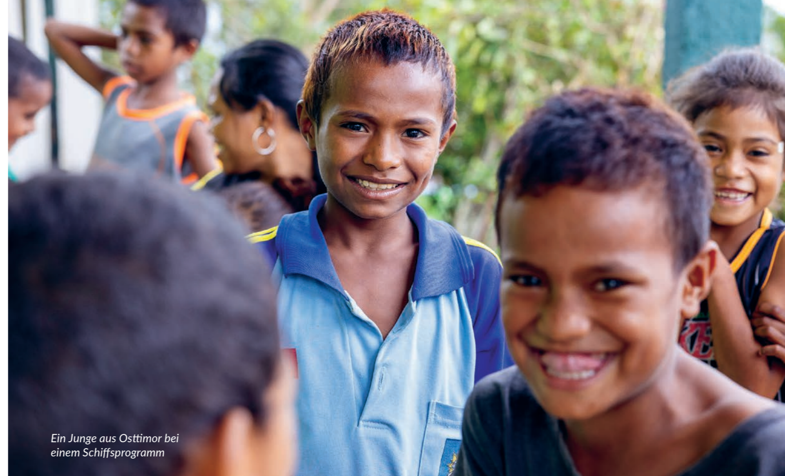
Ein Junge aus Osttimor bei einem Schiffsprogramm

Mehr Informationen unter einsatz.de@om.org oder unter der Telefonnummer 06261 947-0