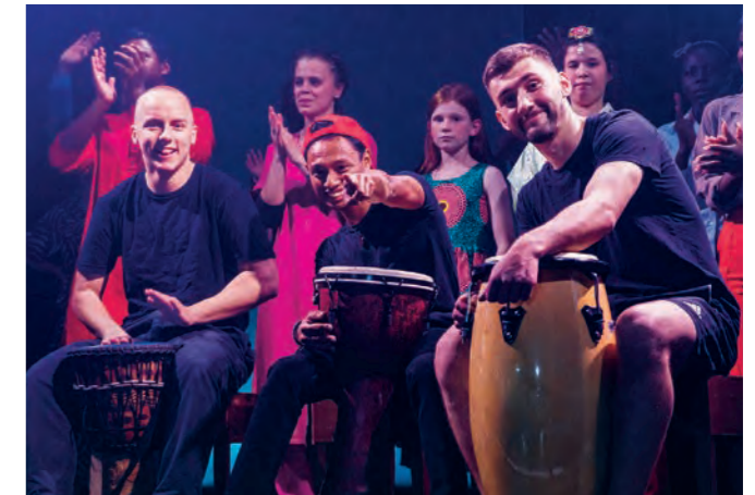
Die verschiedenen Kulturen an Bord werden bei der Veranstaltung Meet the World gefeiert