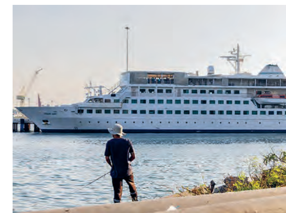
Die Doulos Hope in Malaysia