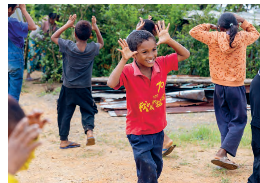
Ich verbringe einen lustigen Tag mit den Kindern hier in Osttimor

Ich verbringe den Tag in der Schule und helfe den Schiffsmitarbeitern beim Auspacken und Einräumen der Bücher. Jenny meint, dass das ein „wirklich großer Segen“ für die Kinder und die Schule ist. Und das glaub ich auch. Bildung ist so wichtig und ich freue mich, dass ich mithelfen durfte!