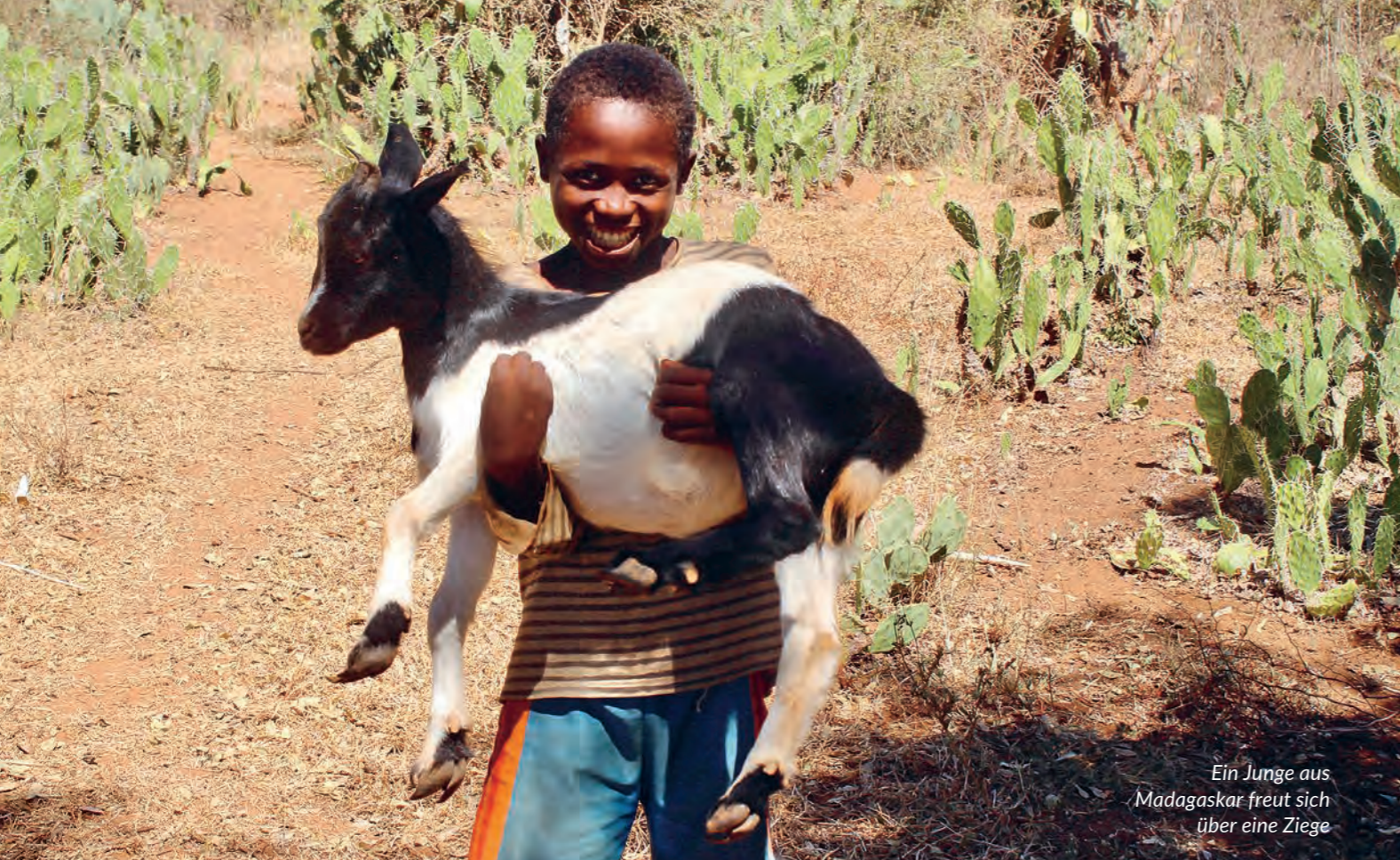
Ein Junge aus Madagaskar freut sich über eine Ziege