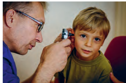
Bei einer Untersuchung in Osteuropa