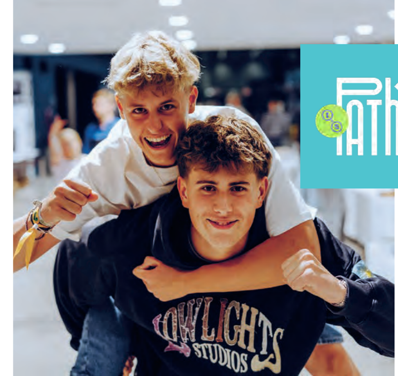
Zwei Teenager voller Freude bei TeenStreet