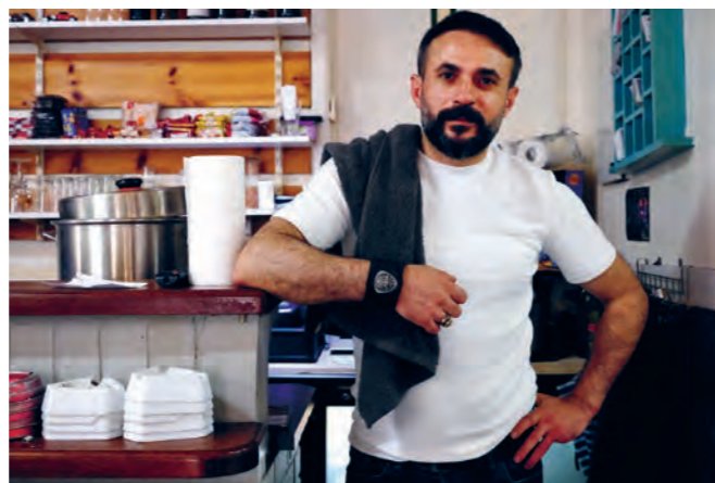
Edip weiß heute, dass Jesus immer bei ihm ist