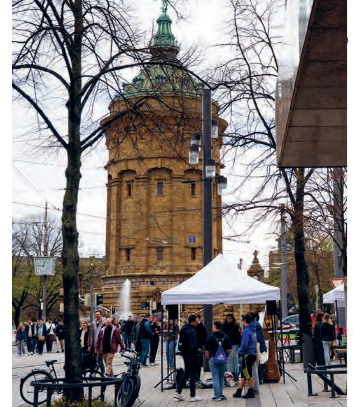
Die Ostereinsatz-Aktionen am Wasserturm