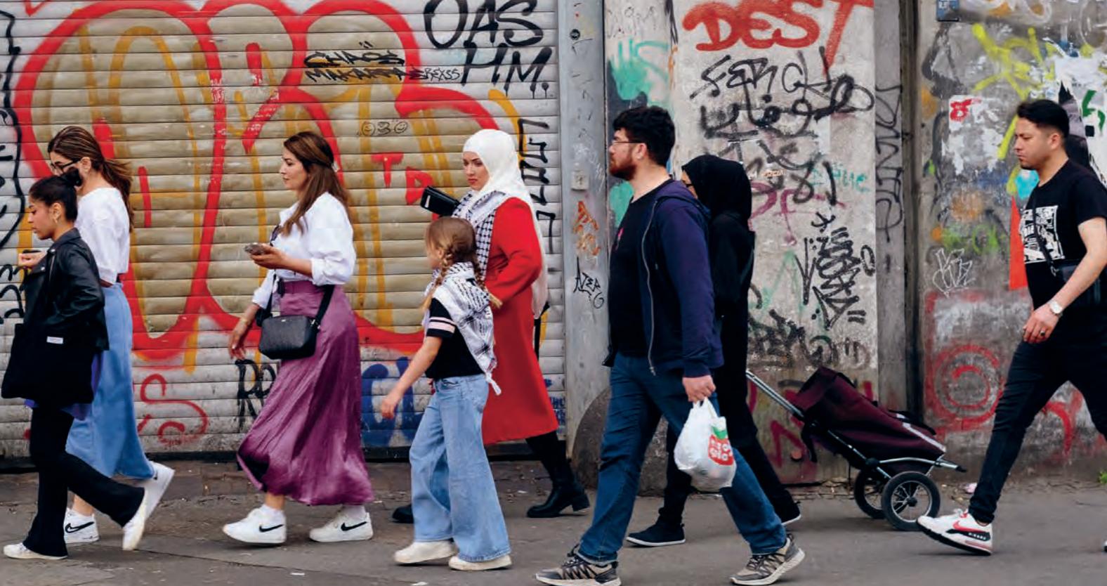
Viele Muslime in Deutschland möchten mehr über die Propheten im Alten Testament wissen