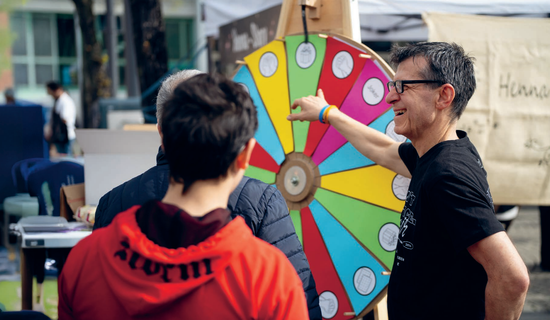
Durch das Segensrad ergaben sich viele gute Gespräche