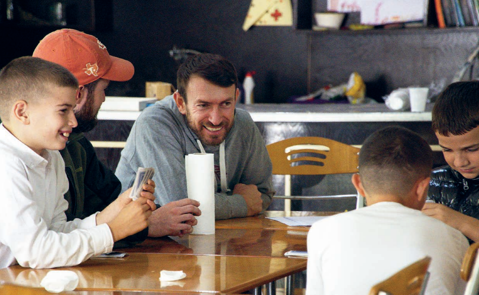
Flori im Gespräch mit Jugendlichen