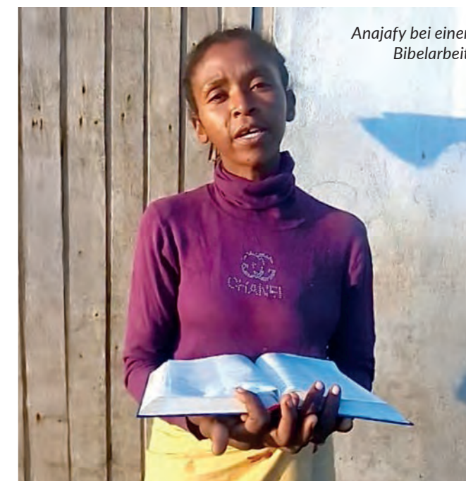
Anajafy bei einer Bibelarbeit