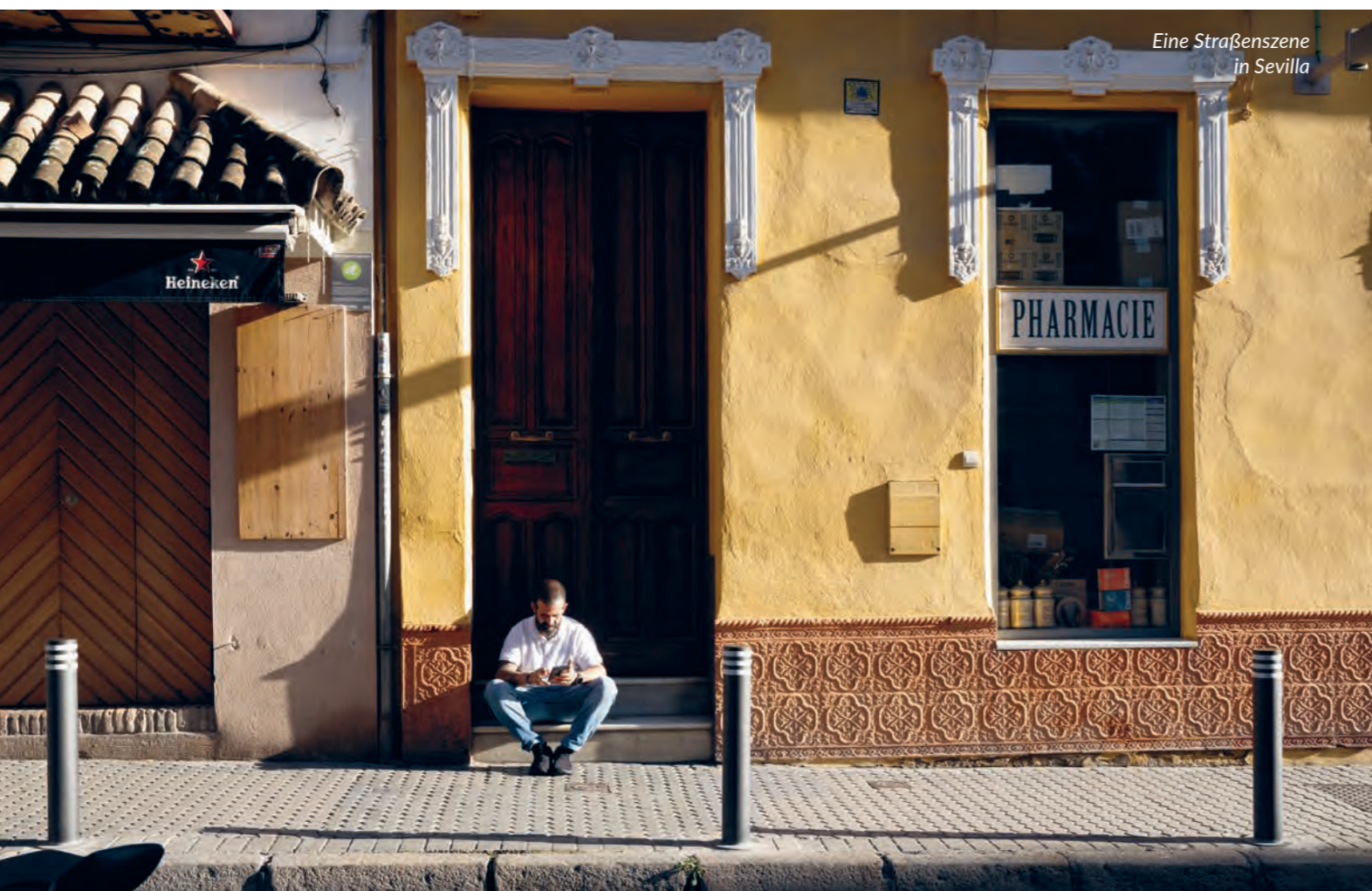
Eine Straßenszene in Sevilla