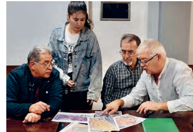
Mitarbeiter der Gemeinden bereiten die Verteilaktion vor

dann eine Gruppe von etwa zehn jungen Menschen, die allesamt begeisterte Freiwillige während des Schiffsbesuchs gewesen waren, große Begeisterung dafür, ihre Gaben und Fähigkeiten bei Straßeneinsätzen und in der Jüngerschaft einzusetzen. Mit Unterstützung der Pastoren fingen sie bald an, durch die Straßen von Sevilla zu ziehen. Ausgerüstet mit Materialien gaben sie Hoffnung weiter und mobilisierten die