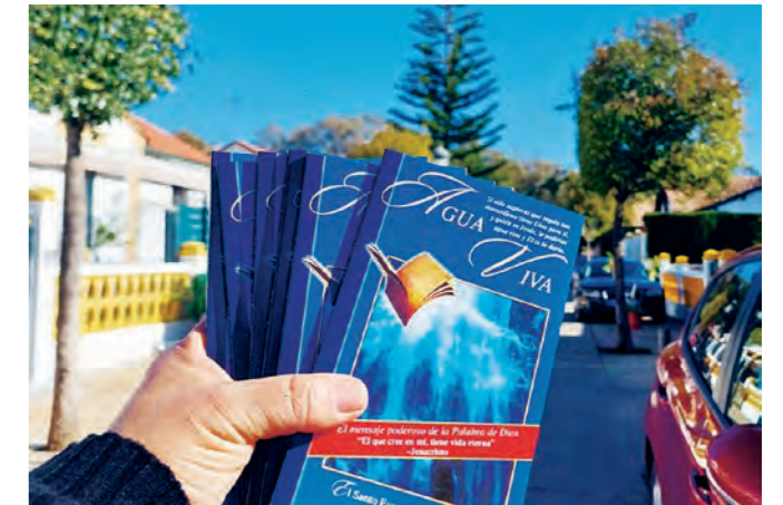
Das Johannesevangelium ‚lebendiges Wasser‘