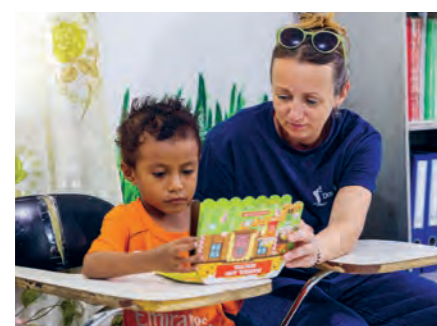
Die Kinder freuen sich sehr

Boah, das sind aber viele Bücher – und die sind ganz schön schwer. Aber ich helfe gerne mit, die Bücher in Kisten zu packen. Denn immerhin sind die Bücher für Kinder und wann immer es um Kinder geht, bin ich gerne mit dabei!