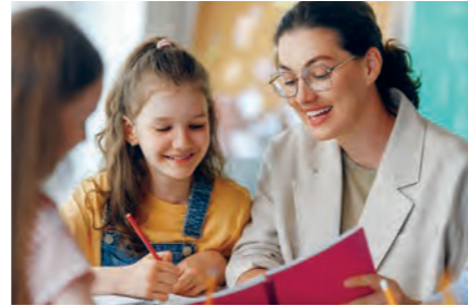
Lernhelfer unterstützten OM-Familien

Wir suchen Fachkräfte im Gesundheitswesen (Ärzte, Pflegekräfte, Zahnärzte u. a.), die durch ihren Beruf Menschen helfen und ihnen bei der Gesundheitsversorgung auch die Liebe Jesu näherbringen möchten. Alle Fachrichtungen sind willkommen. Der Einsatz findet vom 16. – 22. November 2026 statt und es werden grundlegende Gesundheits-, Bildungs- und Vorsorgeleistungen angeboten.