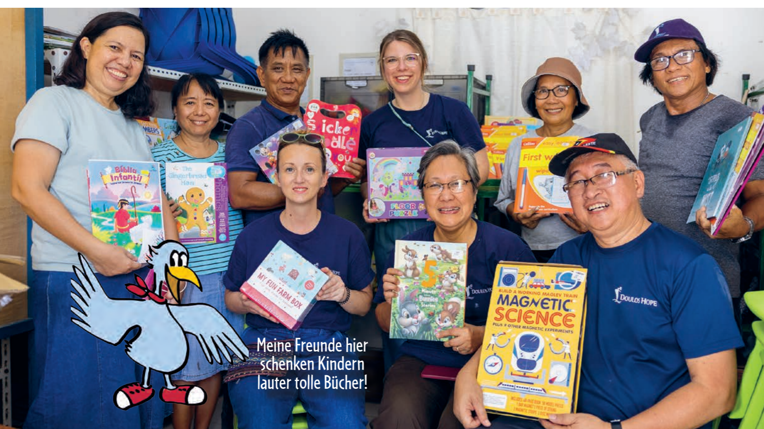
Meine Freunde hier schenken Kindern lauter tolle Bücher!