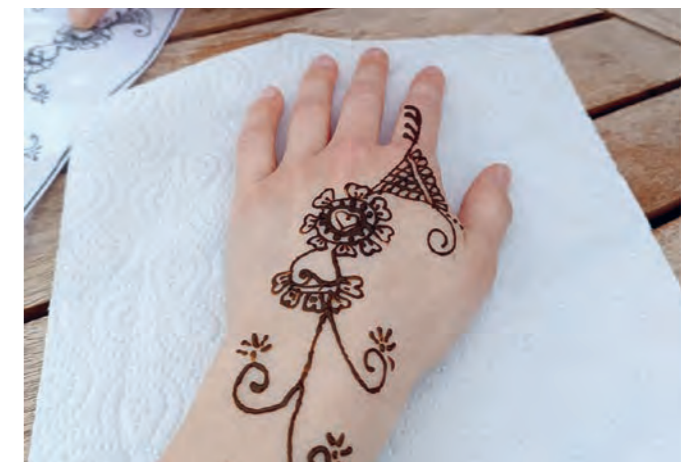
Das fertige Henna zeigt die Geschichte vom verlorenen Sohn