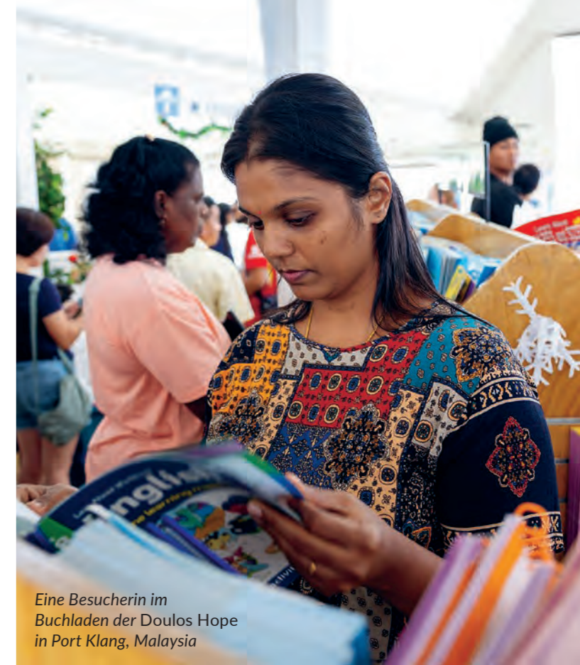
Eine Besucherin im Buchladen der Doulos Hope in Port Klang, Malaysia

Auch in Dili war das Schiff gut besucht. „Eine Besucherin im Buchladen sagte, sie habe das Gefühl gehabt, schon einmal hier gewesen zu sein“, berichtet ein Schiffsmitarbeiter. „Daraufhin recherchierte sie über die Doulos Hope und stellte fest, dass sie vor 17 Jahren die Doulos besucht hatte.“ Die