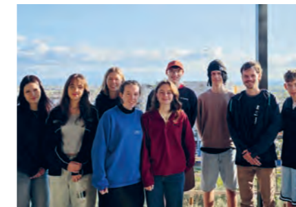
Die begeisterten Teilnehmer des Einsatzes